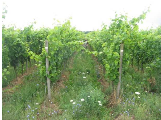
Vignes expérimentales à Geisenheim (Allemagne)